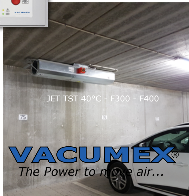
JET TST 40°C - F300 - F400