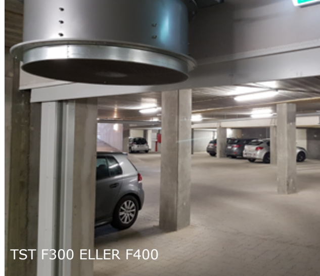
TST F300 ELLER F400